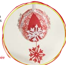
Boule de Noël flocon terminée

Couper et plier en deux un ruban «Étincelles de Noël» de 40 cm de long. Avec 2 brins de fil rouge, piquer au centre du ruban, en traversant les 3 rubans au bout de la boule. Faire quelques petits points de couture pour bien fixer l'accroche et faire un noeud.